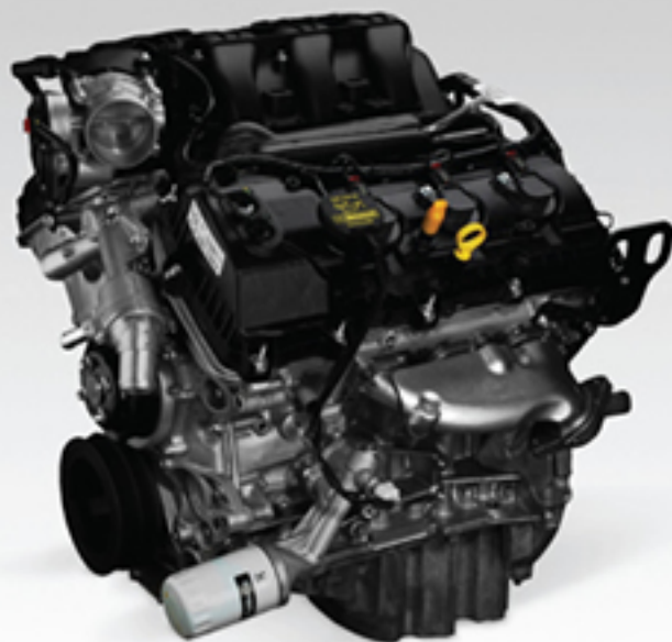
Motor TiVCT 3.7L V6 305hp